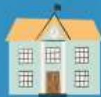
Tierschutz Hof in Kita und Schule

Die Möglichkeit für ein persönliches Treffen auf dem Tierschutzhof in Varenseil bieten wir im Oktober 2024 sowie im Mai 2025. Außerdem besteht die Möglichkeit, den Varenseiler Tierschutzhof von Achtung für Tiere mit Kitakindern oder SchülerInnen zu besuchen.